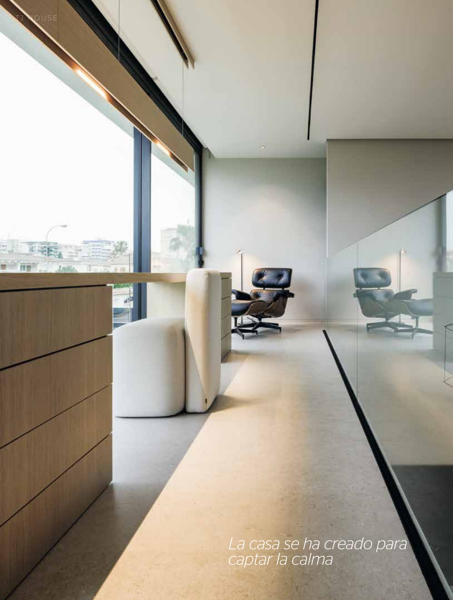
La casa se ha creado para captar la calma